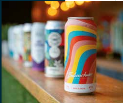
Bière blanche à l'image de l'Embouchure, crédit photo : Marie et Sam