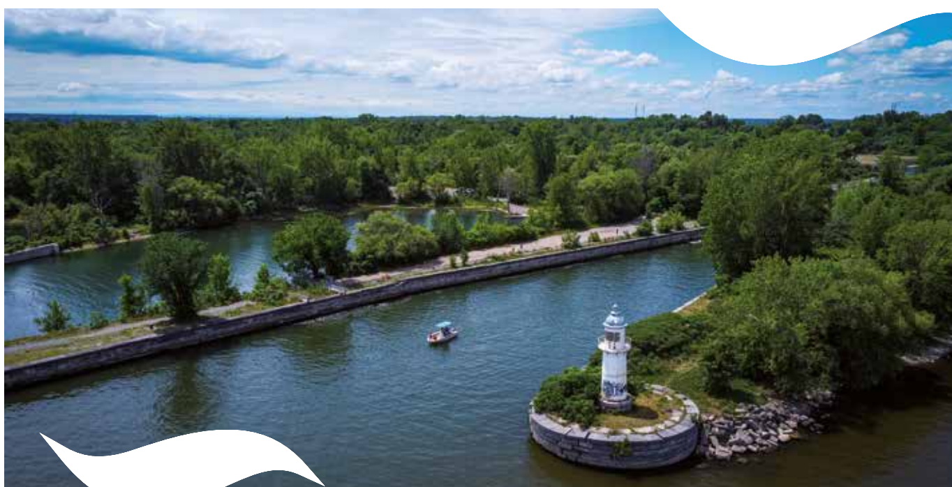
Canal de Soulanges, crédit photo : Étienne Lamoureux