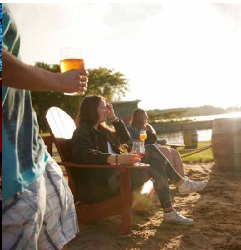
Village des Écluses, soirée de clôture