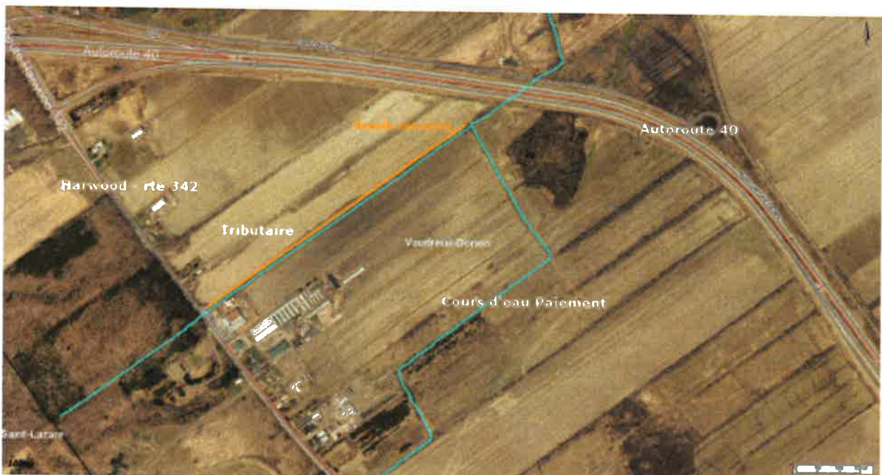
Tributaire cours d'eau Paiement à Vaudreuil-Dorion

d'octroyer un mandat à la firme Génipur afin de répondre aux questions du MELCC, afin de réaliser les plans et devis en vue de l'appel d'offres et afin de réaliser la surveillance des travaux, au montant maximal de 8 623,13 $, incluant les taxes applicables.