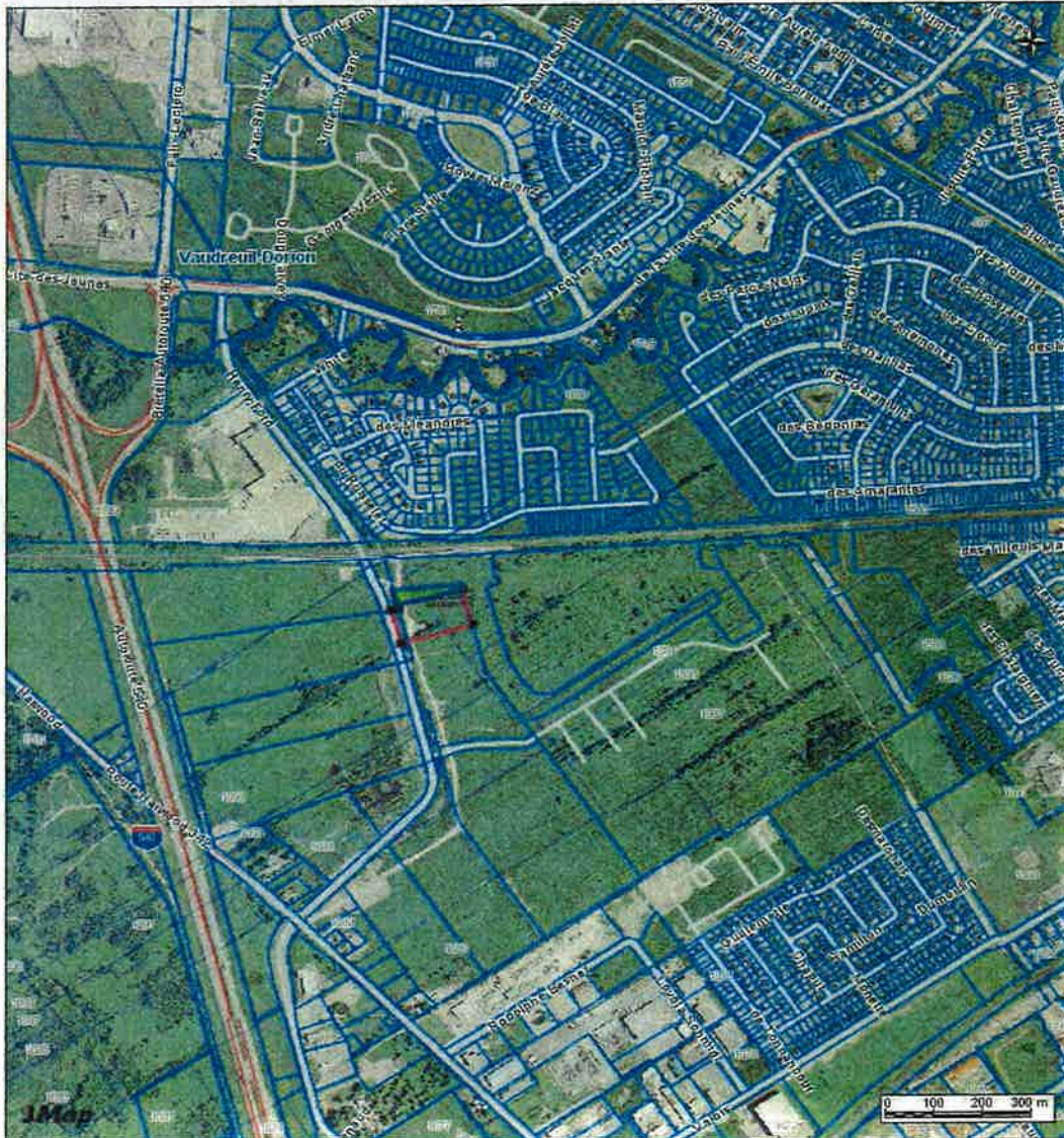
Figure 1 Vue générale des environs